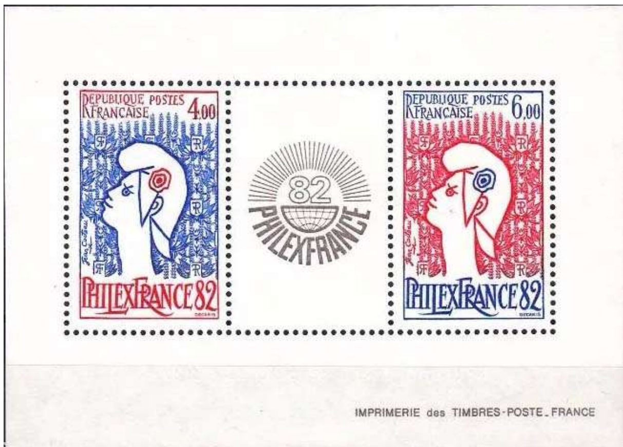
Hoja Bloque para conmemorar PHILEXFRANCE 82