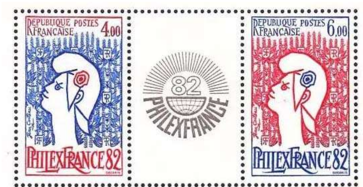
Sellos emitidos para conmemorar PHILEXFRANCE 82