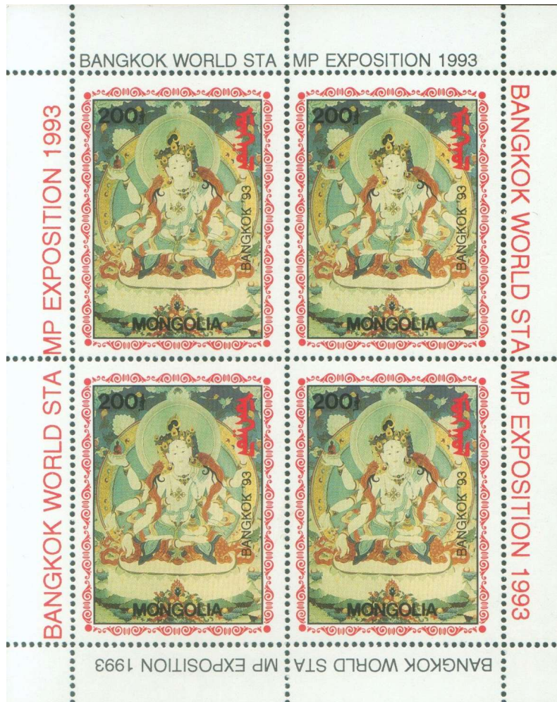
Hoja Bloque conmemorativa