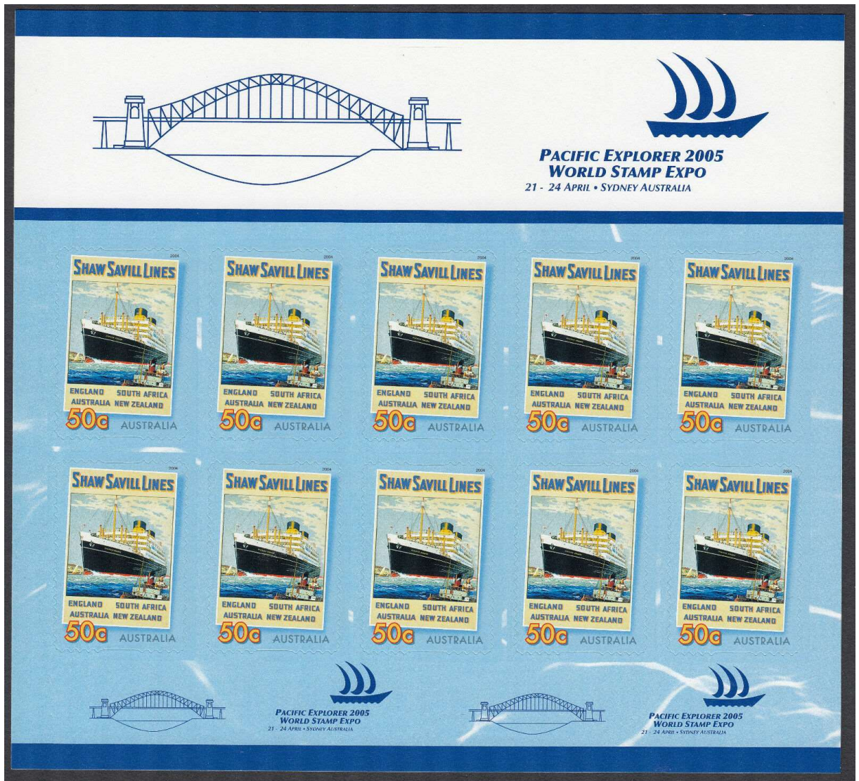
Pliego Sellos Pacific Explorer