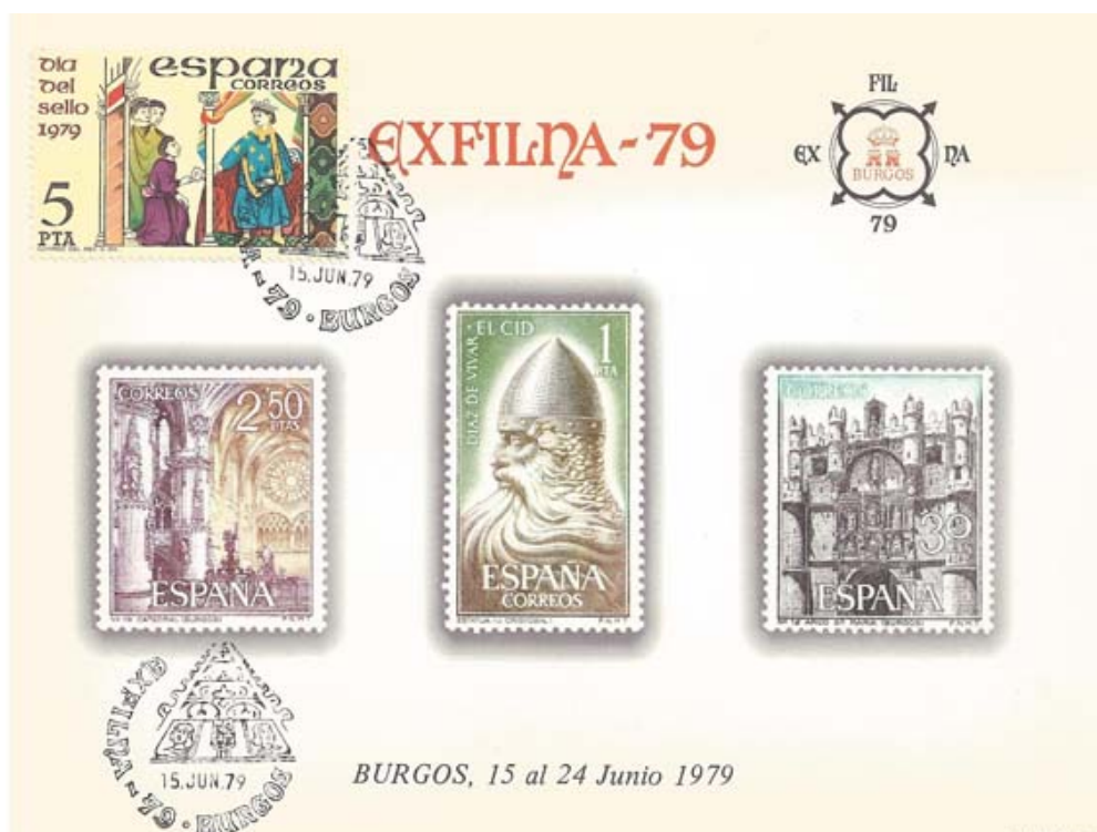
Tarjetón oficial conmemorativo