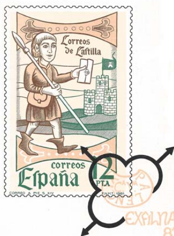
DIA DEL SELLO 1981 CORREOS DE CASTILLA

Se utilizaron cuatro matasellos, de Primer Día, Generalde la Exposición, Asamblea Nacional de Filatelia y Seminario Juvenil.