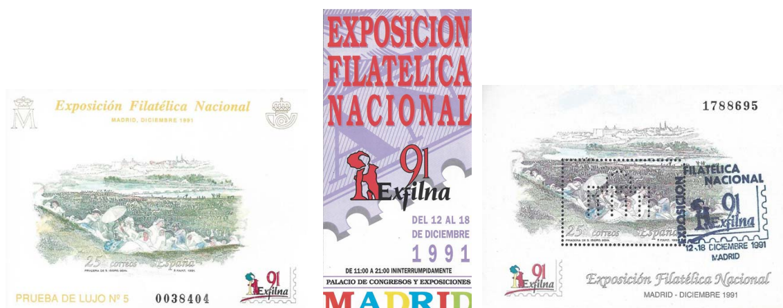
Prueba de lujo

Se cortó la cinta inaugural y el séquito encabezado por el Alcalde de Madrid realizó la visita al recinto de la exposición, donde se albergaban los 1060 cuadros correspondientes a las 134 colecciones presentadas (10 en Clase Maestra, 1 en la Corte de Honor, 2 en la Clase Oficial y 121 en la Clase de Competición), más 25 de Literatura Filatélica.