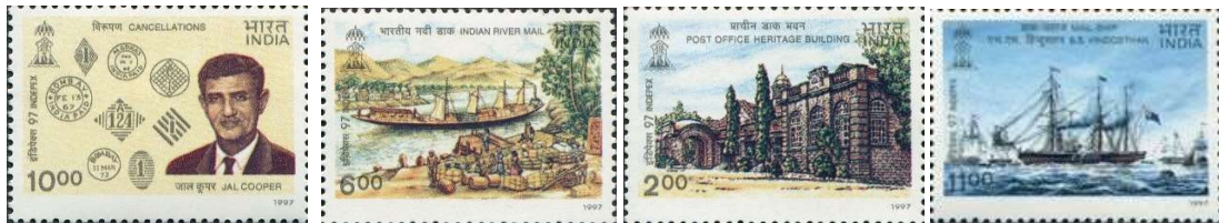
Series conmemorativas de la Exposición