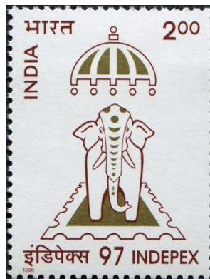
Sello con el Logotipo de la Exposición