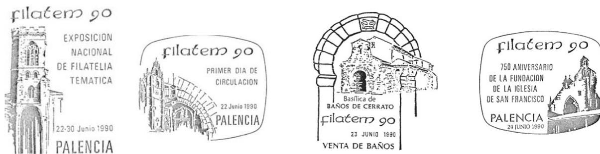
S.E.P. conmemorativos de FILATEM-90,