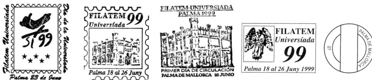
Matasellos especiales de FILATEM-99

Al igual que las dos anteriores, una Hoja Bloque fue emitida para conmemorar la FILATEM y la Universiada de Palma de Mallorca. Dos matasellos especiales, uno de P.D.C. y un rodillo de propaganda que funcionó durante todo el mes de junio, fue el material filatélico emitido para esta exposición.