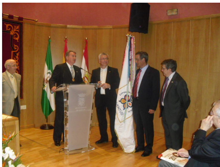
Programa y acto de entrega de la bandera para JUVENIA-2013