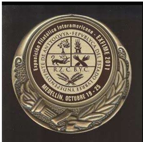
Medalla de la Exposición