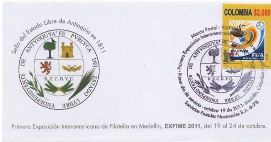
Sobre de Primer Día