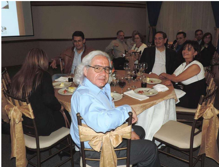
Participantes en ExpoAFE, al fondo el Comisario español