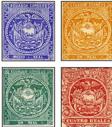
Primera emisión de Ecuador