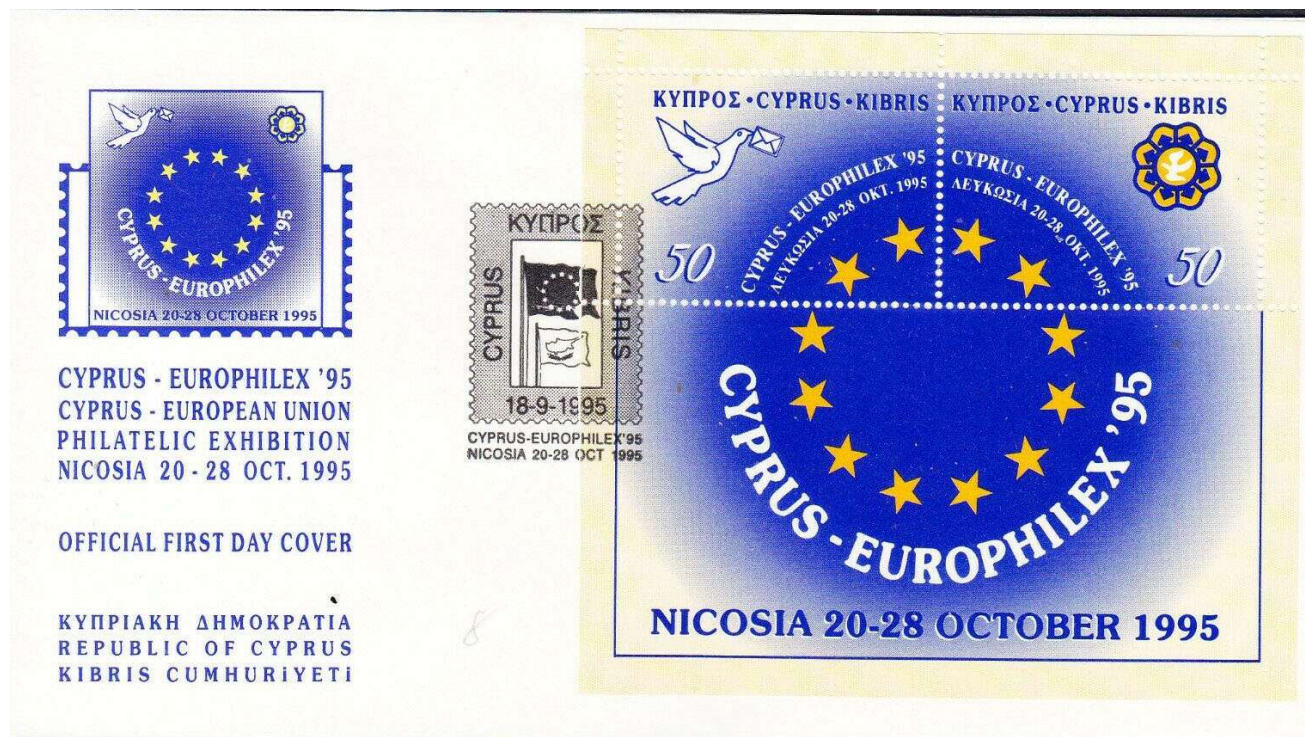
Sobre oficial de primer día