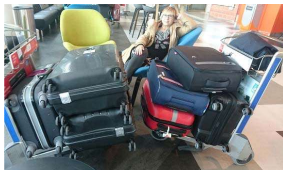
La no conocida ni envidiada vida del comisario